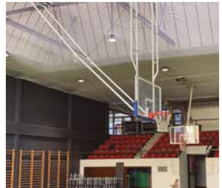
Argiteria, sarea eta harmaila itxuraldatuta.