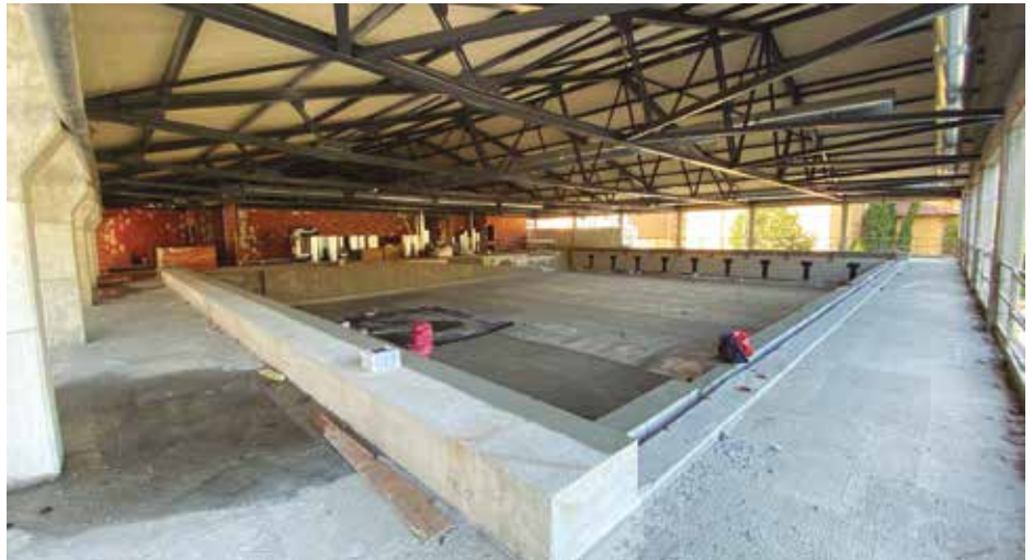
9 kale izango ditu igerileku handiak; lehengoak 5 zituen.