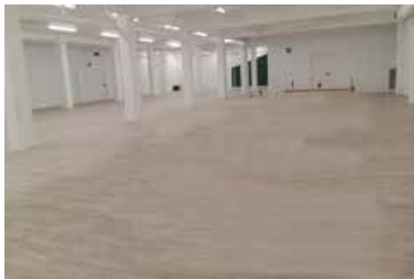
Urgain-Errekalde eskolako sotoko gela irekia

▲ URGAIN-ERREKALDE. Fitness jardueretako aforoa handitu eta osasun baldintzak bermatu ahal izateko, ekintza batzuk (ikusitako goiko taula) Urgain-Errekalde eskolako sotoko gela irekian egingo dira. Ez da aldagela eta dutxa zerbitzurik egongo bertan.