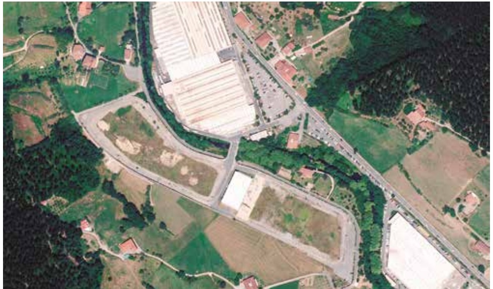
Munazategin Packaging, Eraikuntza eta Agricola negozioetako pabilioi bana eraikiko du Ulmak.

Uste dut errotonda hori oso mesedegarria izango dela, ez bakarrik Ulma Eraikuntzako eta Munazategira etorriko diren langileentzat, baita Oñatiko beste enpresa batzuetara etortzen direnentzat, edota herritik kanpora