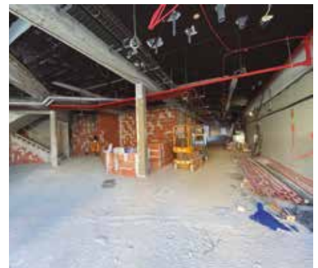
Sarrera berria hasi da itxuratzen.