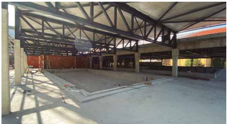
Igerileku txikiak 16x8 m.-ko azalera izango du; (lehengoak 12,5x6 m.).