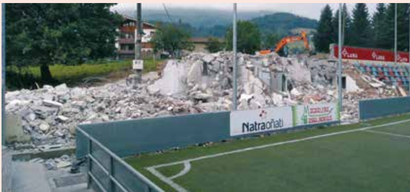
Uztailean eraitsi zuten Azkoagaineko aldagela eta bulegoen eraikin zaharra