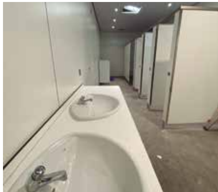
Kantxa berdeko aldagelen ondoko komuna.