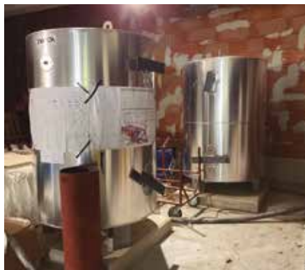
Geotermia eta galdara gela.