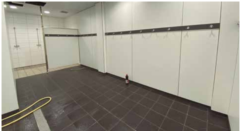
Kantxa berdeko aldagela berrietako bat.