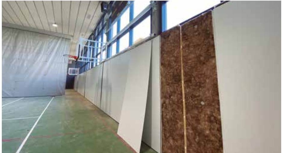
Kantxa berdeko paretako isolamendua eta gaineko kristaldegia erabat berritu dira.

Kiroldegia eraberritzeko lehen faseko lanek 8,5 milioi euroko aurrekontua dute.